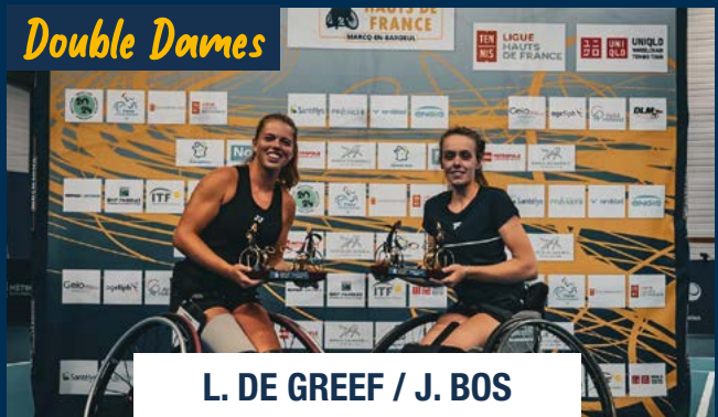
L. DE GREEF / J. BOS